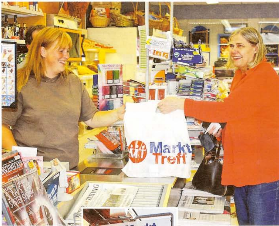
Wocheneinkauf im Markttreff Gülzow: Hier sind über 4000 gelistete Artikel im Angebot.